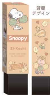
チアリーディング部